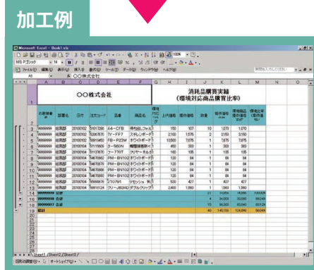
※「楽々帳票作成」で加工したものです。

詳しくは「@office カスタマーセンター TEL: 0120-232-640」までお問合せください。